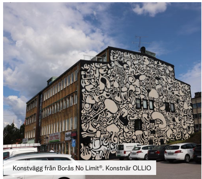
Konstvägg från Borås No Limit®. Konstnär OLLIO