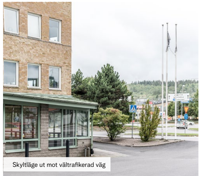
Skytlläge ut mot vältrafikerad väg