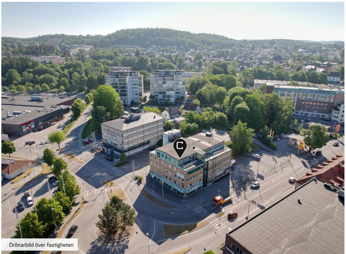
Drönbild över fastigheten