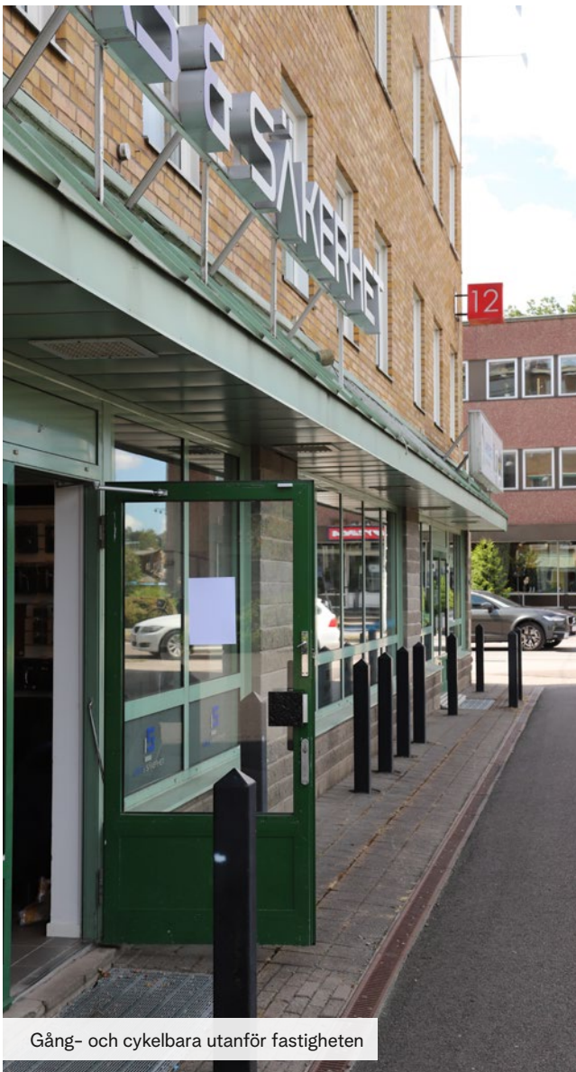
Gång- och cykelbara utanför fastigheten