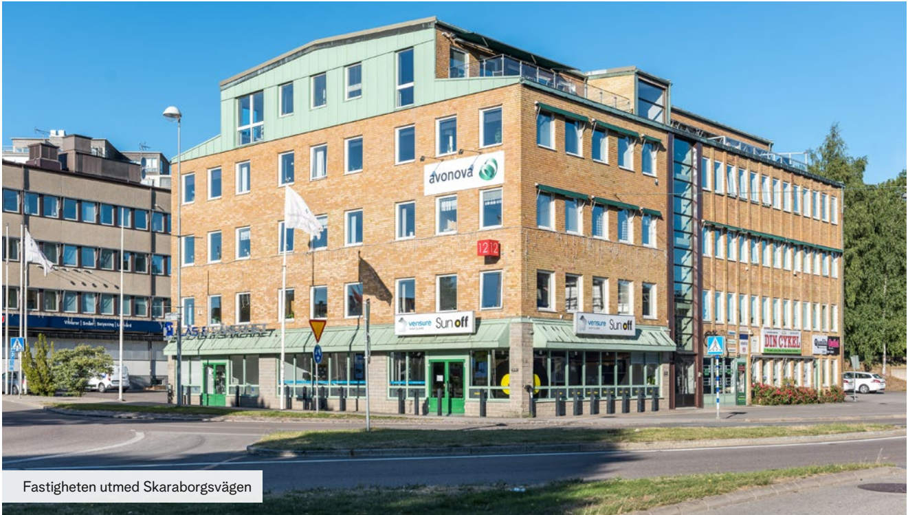
Fastigheten utmed Skarborgsvägen