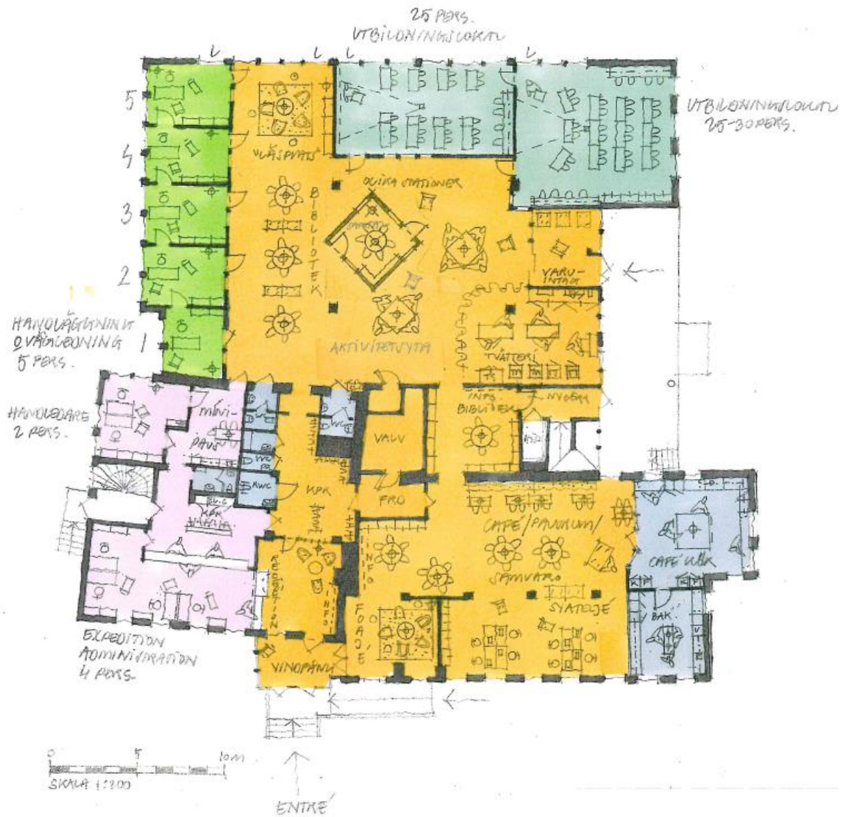
Entréplan 1065 kvm