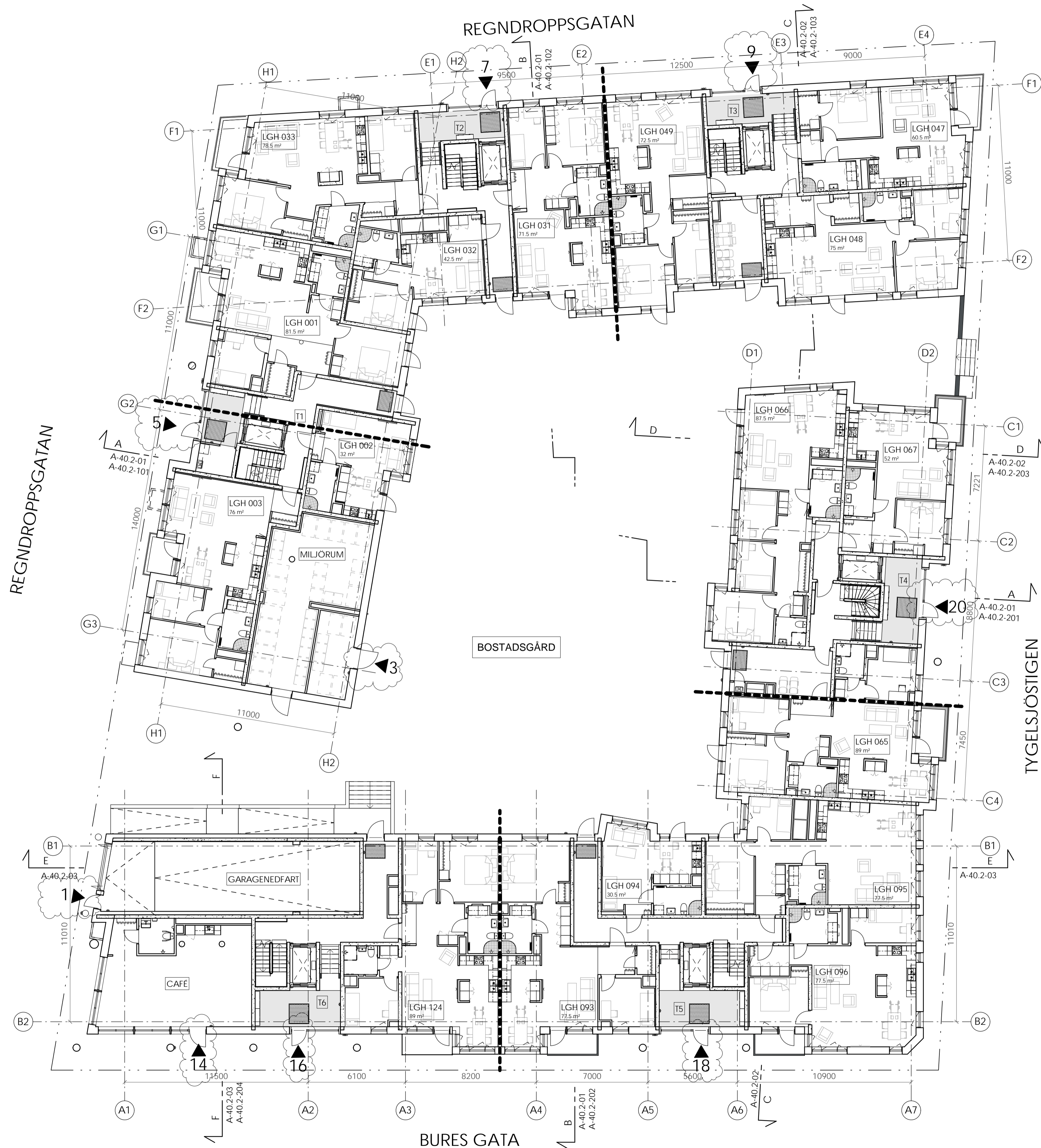
Plan 10, Entréväning 1 : 150

ADRESS LOKAL: BURES GATA 14 ADRESS TRAPPHUS 1 HUS 1: REGNDROPPSGATAN 5 ADRESS TRAPPHUS 2 HUS 1: REGNDROPPSGATAN 7 ADRESS TRAPPHUS 3 HUS 1: REGNDROPPSGATAN 9 ADRESS TRAPPHUS 4 HUS 2: TYGELSJÖSTIGEN 20 ADRESS TRAPPHUS 5 HUS 2: BURES GATA 18 ADRESS TRAPPHUS 6 HUS 2: BURES GATA 14 ADRESS GARAGE: REGNDROPPSGATAN 1 ADRESS MILJÖRUM: REGNDROPPSGATAN 3