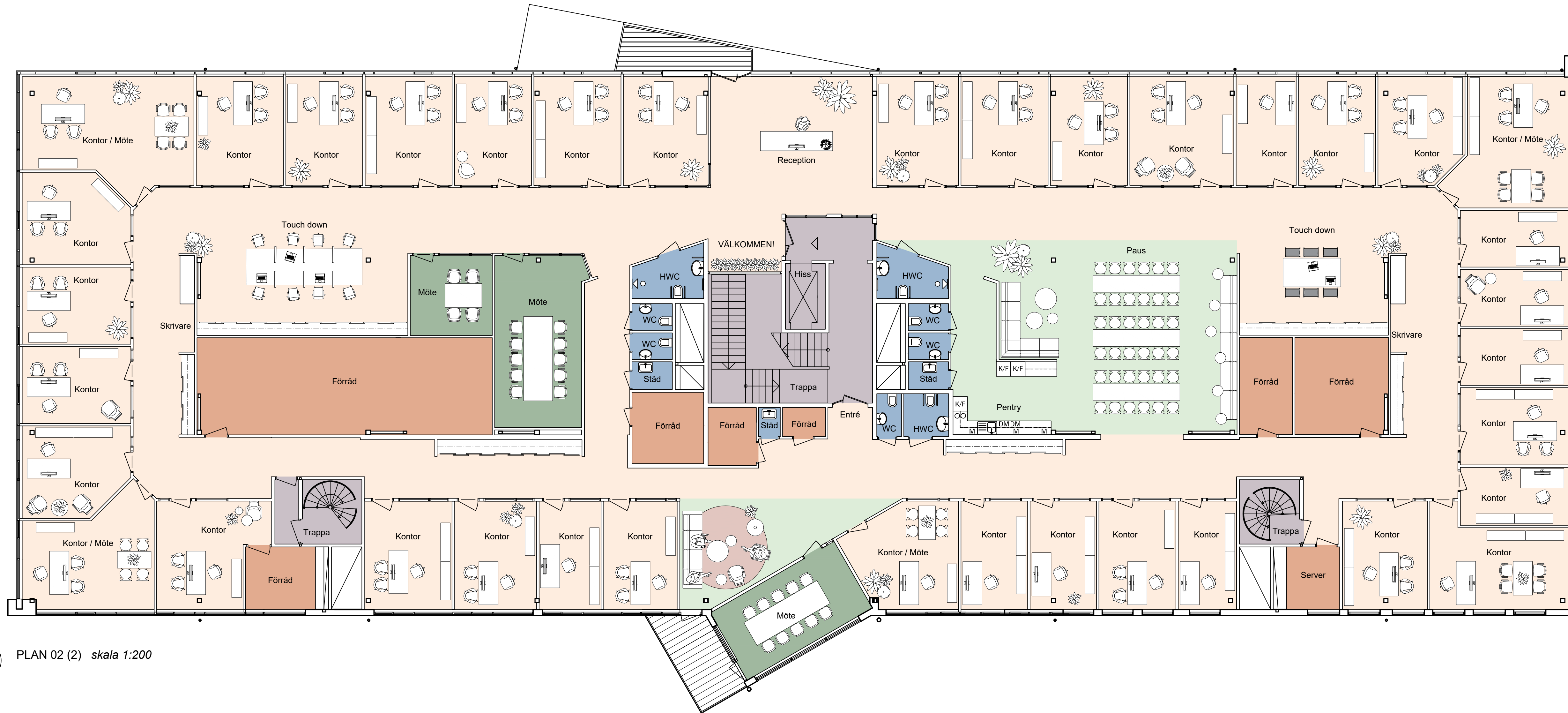
PLAN 02 (2) skala 1:200