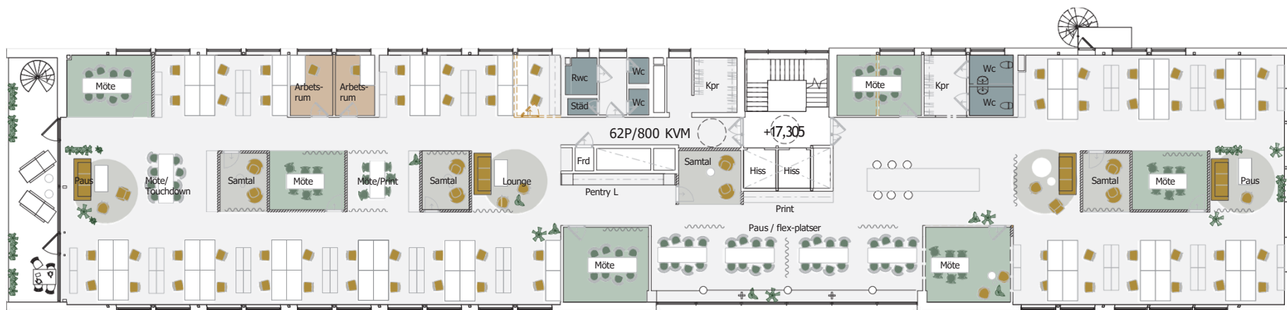
Vån 5, Plan 6