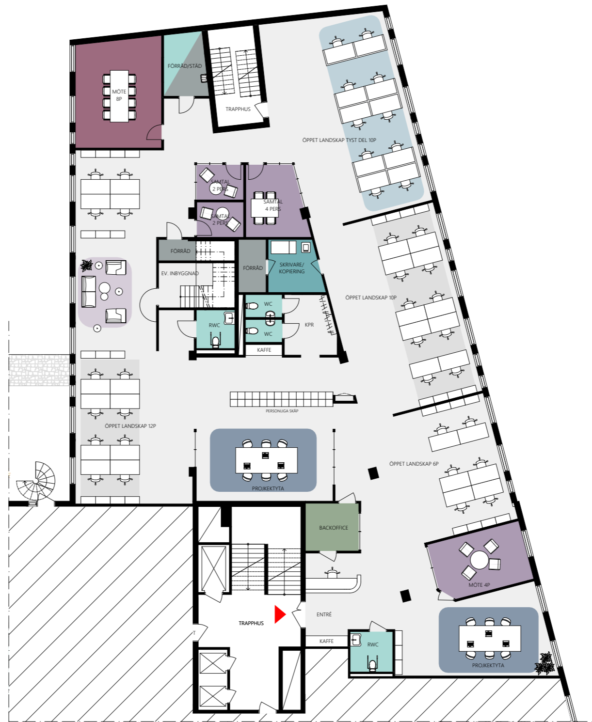
PLAN 5, 2 TR